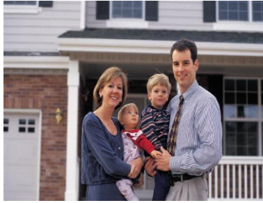
Représentant- e-s légal-e/aux