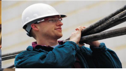
Berufsbildner/in im Lehrbetrieb